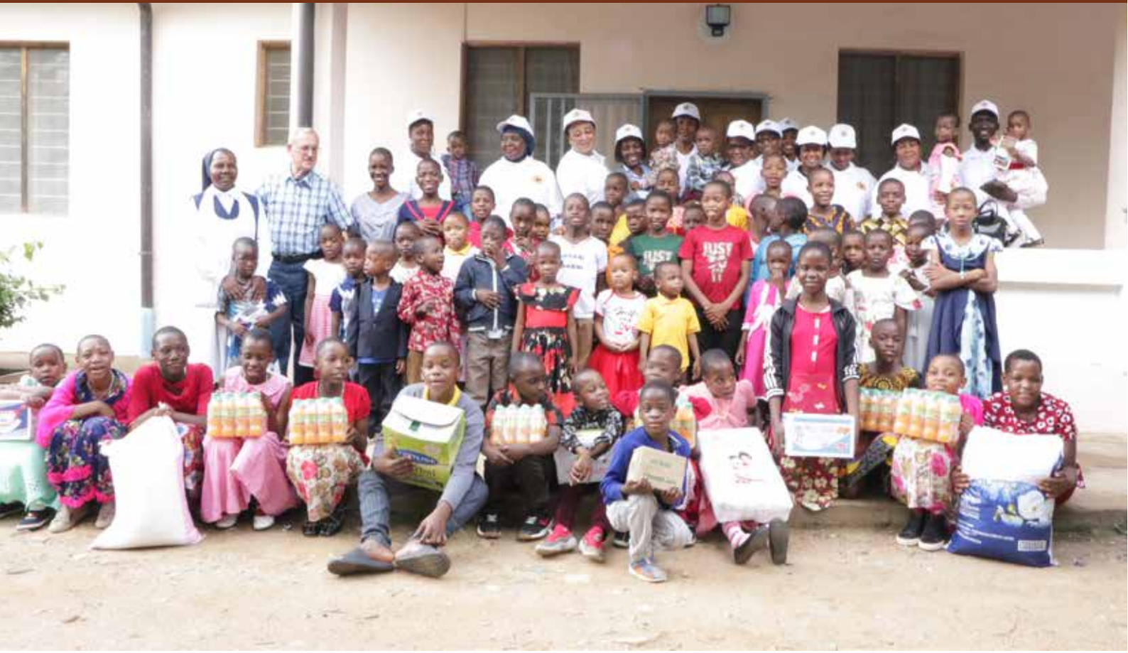
Wawakilishi wa wanawake kutoka Tume ya Taifa ya Uchaguzi wakiwa kwenye picha ya pamoja na watoto yatima wanaolelewa kwenye Kijiji cha Matumaini kilichopo Kisasa jijini Dodoma.